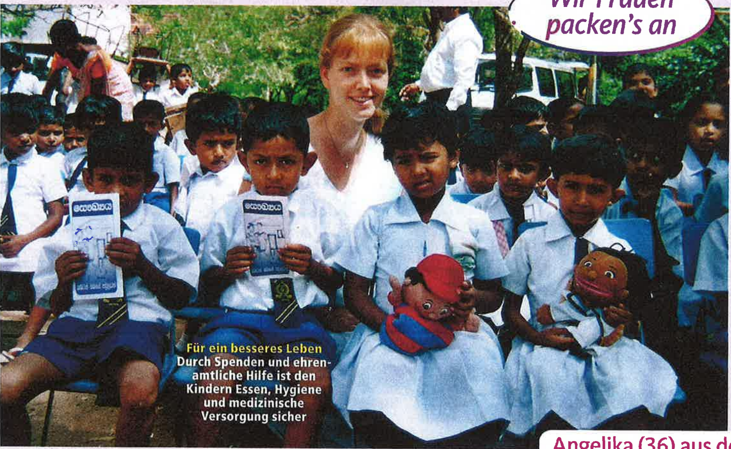
Für ein besseres Leben Durch Spenden und ehrenamtliche Hilfe ist den Kindern Essen, Hygiene und medizinische Versorgung sicher