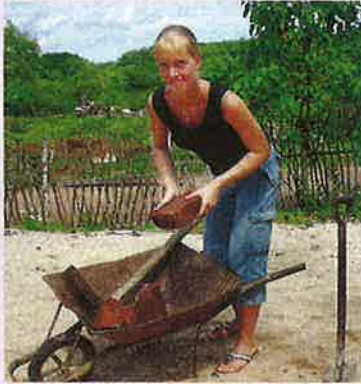
Stein für Stein ▶ Die 36-Jährige legt den Grundstein für das Heim

r Pfalz hilft ehrenamtlich auf Sri Lanka