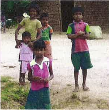
◀ Besonderer Spitzname „Angel“ – so nennen die Kleinen ihre Retterin